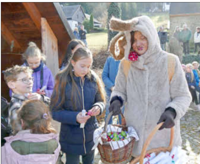
Der Osterhase im Einsatz