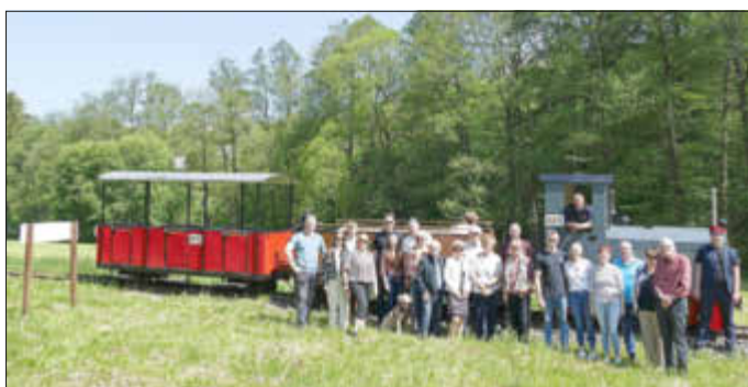
Eine Fahrt mit der Feldbahn ist auch auf Bestellung zu bekommen.