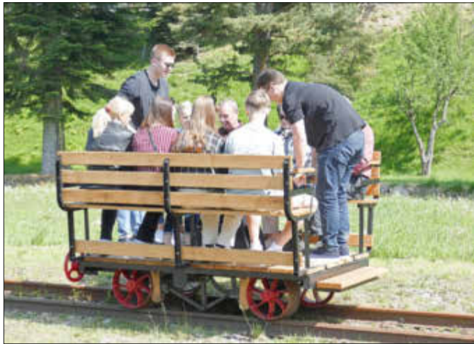
Die Fahrten mit der Handhebeldraisine.