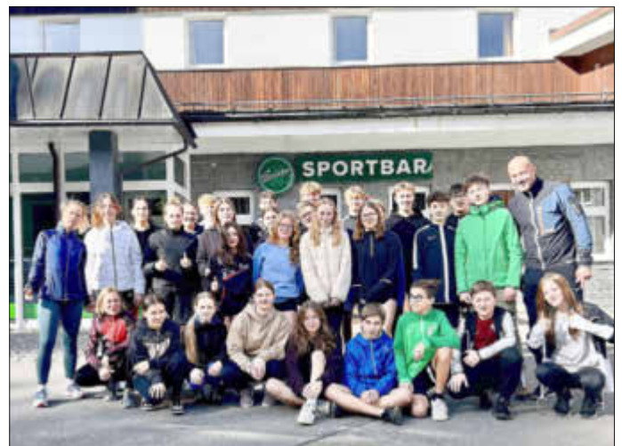
Teilnehmer des Trainingslagers