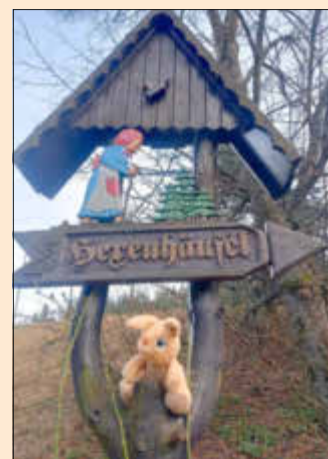
Schild Hexenhäusel Breitenbrunn