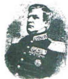
Carl Ludwig Scabell

16.01.1851 – Berlin: Der preußische Innenminister entscheidet zugunsten seiner staatlichen Polizeibehörde und unterzeichnet kurz darauf die Verfügung über die Gründung der Berliner Feuerwehr. Mit deren Leitung wird am 01.02.1851 Carl Ludwig Scabell beauftragt. Bereits am 18.06.1851 stellt Scabell dem Polizeipräsidenten von Hinckeladay die fertig ausgebildete Berufsfeuerwehr vor. Sie besteht aus turnerisch gewandten Bauhandwerkern als Feuerwehrmänner sowie Spritzenmännern als Pumpenmannschaften vor. Die Dienstzeit beträgt 48 Stunden mit anschließend 24 Stunden Freizeit. Das Personal umfasste: 1 Branddirektor, 1 Brandinspektor, 4 Brandmeister, 40 Oberfeuerwehrmänner, 180 Feuerwehrmänner, 360 Spritzenmänner. So verlassen die Fahrzeuge und Mannschaften innerhalb von 2 bis 3 Minuten nach der Alarmierung die Wache. Entscheidend für die rasch erzielten Erfolge ist aber, dass die Berliner Feuerwehr als Nachrichtenmittel den elektrischen Zeigertelegraphen erhält, der alle Wachen verbindet.